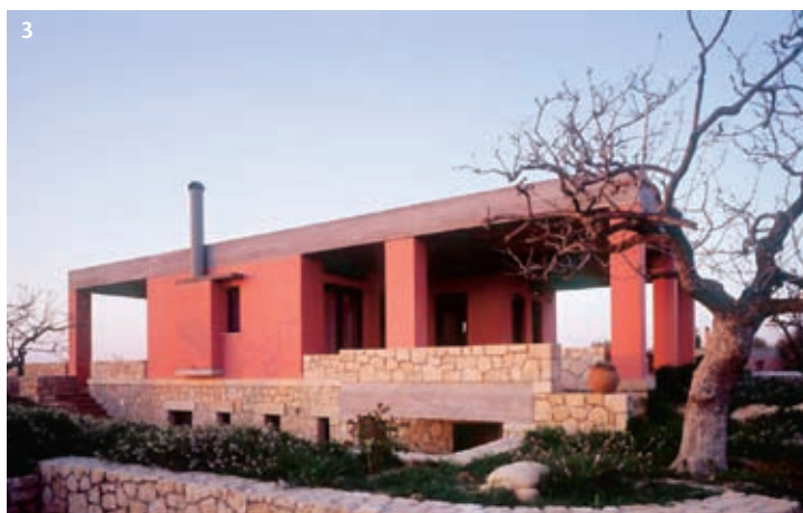
Φωτογραφίες τρισετάσες Ηλίας Μεσσίνας Φωτογραφία 3 Erieta Attali

νέος Κανονισμός Ενεργειακής Απόδοσης των Κτιρίων (ΚΕΝΑΚ), ο οποίος επίσης δεν έχει δημοσιευθεί ακόμη, συνεπώς δεν αποτελεί ακόμη διαθέσιμο εργαλείο.