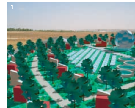
Εικ. 1 Ecovillage Kramim, το πρώτο οικολογικό χωριό της Μ. Ανατολής.

Το Κέντρο Ανανεώσιμων Πηγών Ενέργειας (ΚΑΠΕ) που ανήκει στο υπουργείο Ανάπτυξης, έχει ήδη ολοκληρώσει δύο Κανονισμούς Ορθολογικής Χρήσης και Εξοικονόμησης Ενέργειας (ΚΟΧΕΕ) για τα κτίρια, όμως δεν έχουν δημοσιευθεί ούτε εφαρμόζονται. Για την εφαρμογή της Κοινοτικής Οδηγίας 2002/91 ετοιμάζεται ένας