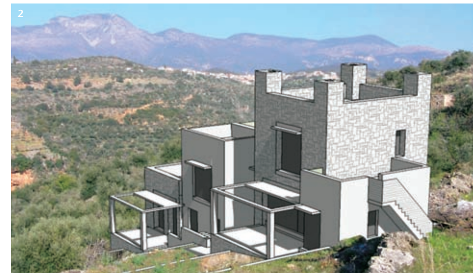
Εικ. 2 Οικία στην Αβία, Μεσοπνιακή Μάνη - συνδιασμός παραδοσιακής αρχιτεκτονικής και βιοκλιματικής αρχιτεκτονικής και οικολογικής δόμησης.